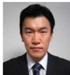
理事長 マインバイタルトガト