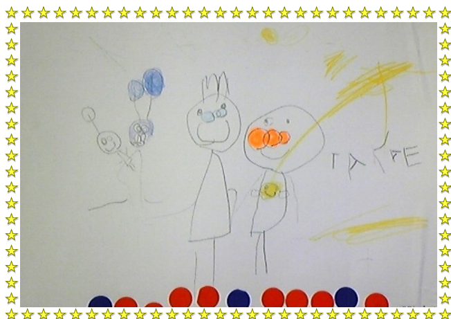
Содзаяа Такаэ, 3 настай