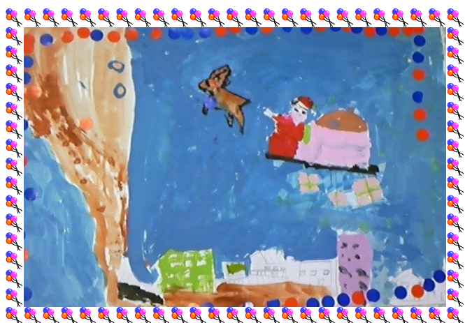
О.Булган, 9 настай