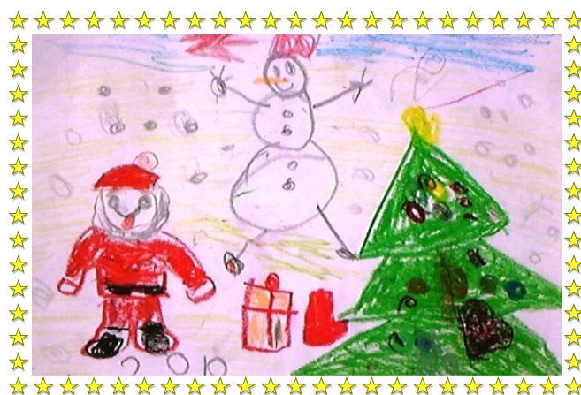
Тамон, 6 настай