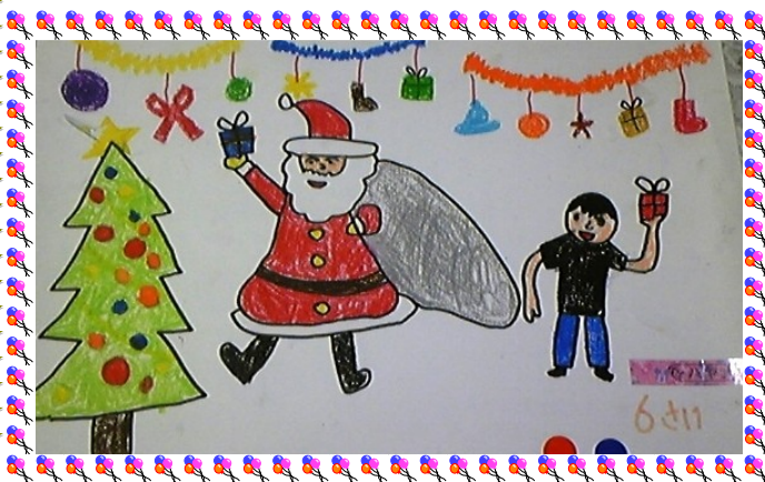
Н.Хаянхярваа, 6 настай