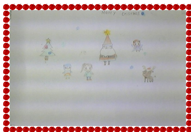
Ч.Мичид, 9 настай