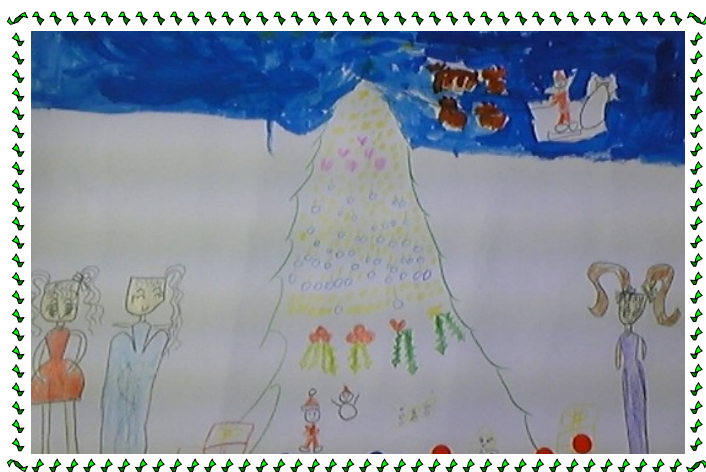
О.Номин, 8 настай